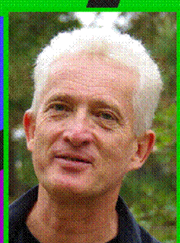
Stéphane Ecole maternelle Villeneuve